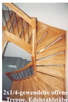
2x1/4-gewendelte offene Treppe, Edelstahlstäbe