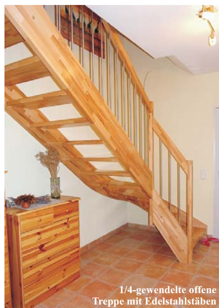
1/4-gewendelte offene Treppe mit Edelstahlstäben

Preise für eine komplette Treppe in Kernbuche parkettverleimt, incl. 19% MwSt. Incl. Aufmaß, Lieferung und Montage im 50 km-Umkreis von Frankfurt /M.