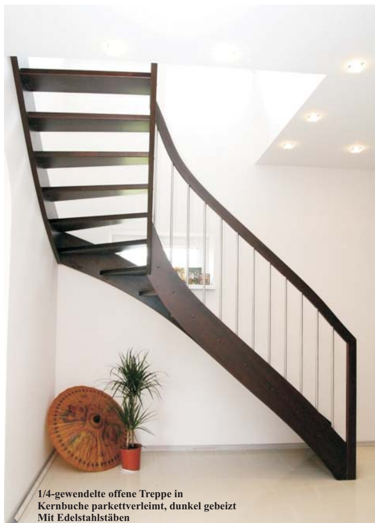
1/4-gewendelte offene Treppe in Kernbuche parkettverleimt, dunkel gebeizt Mit Edelstahlstäben