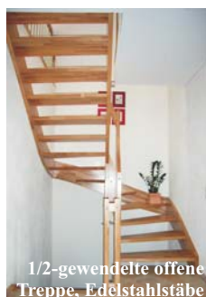
1/2-gewendelte offene Treppe, Edelstahlstäbe