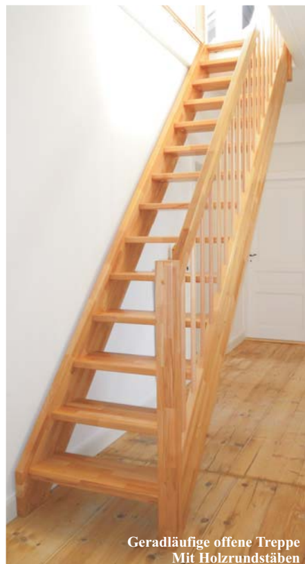
Geradläufige offene Treppe Mit Holzrundstäben

Handwerkliche Maßanfertigung aus Massivholz nach DIN 18334. Hergestellt in Deutschland. Beidseitig eingestemmte Wangentreppe. Stufen-, Wangen- und Handlaufstärke ca. 40 mm. Geländer aus glatten Holzrundstäben Ø ca. 25 mm oder Edelstahlstäben Ø ca. 16 mm, glatten An- und Austrittspfosten ca. 80 x 80 mm oder 80 x 40 mm und glattem Holzhandlauf ca. 80 x 40 mm. Offene Ausführung, ohne Setzstufen. Treppenbreite bis 95 cm. Auftrittsbreite bis 26 cm. Alle Holzteile werden sauber geschliffen und oberflächenfertig versiegelt.